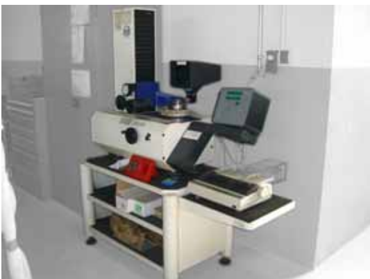
Werkzeugvoreinstellgerät Fabrikat Zoller, Baujahr 1991