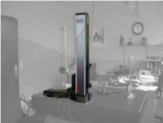
2 Stück Höhenmessgeräte Mauser SPC-V5 für Messhöhe 600 mm, Baujahr 1995/98