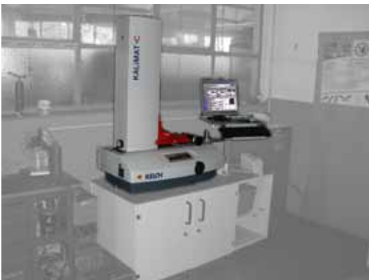
Werkzeugvoreinstellgeräte Fabrikat Kelch, Kalimat-C36, Baujahr 2008