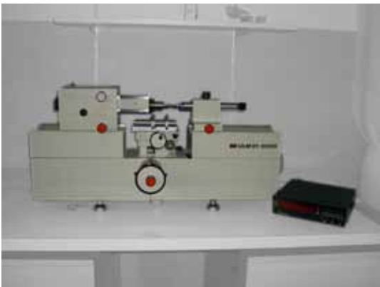
Kalibriergerät Jähner ULM 01-600 D, Baujahr 1987 mit Software zur Messdatenerfassung